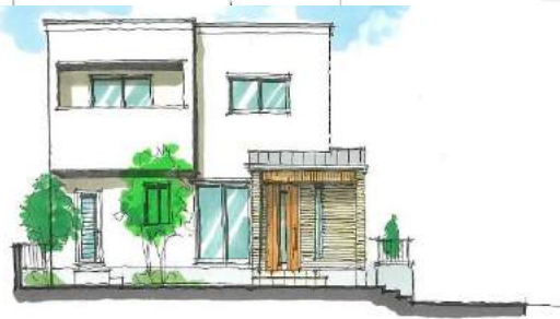
South elevation (南)