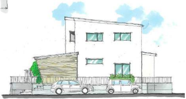
East elevation (東)