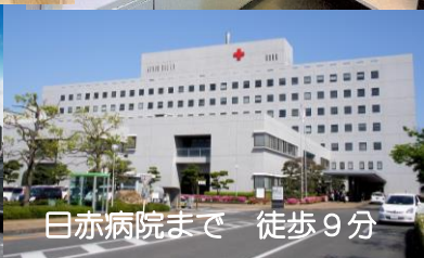
日赤病院まで 徒歩9分