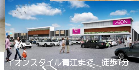
イオンスタイル青江まで 徒歩7分